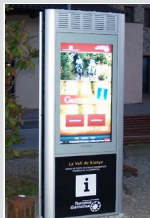
Totem interactif extérieur